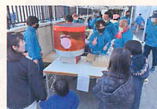
中高生がわたがしコーナー担当