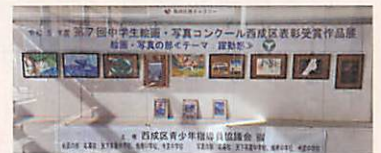
区民ギャラリーでの展示