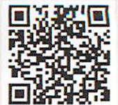
こども相談センター