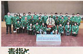
青指と ジュニアユースリーダー