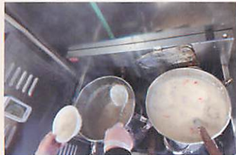
最終日夜の献立はシチュー