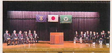
中央区民センターで表彰式