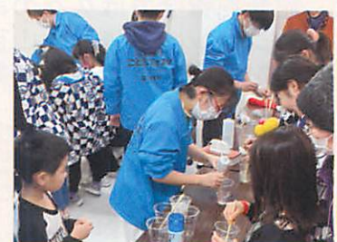
こどもフェスタでスライムづくり