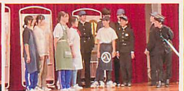
9年「人間になりたい猫」