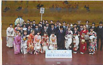
今宮中学校 卒業生