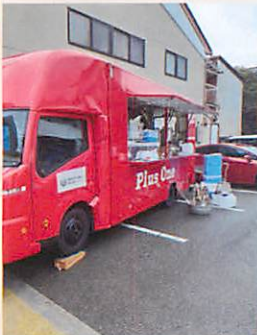
キッチンカーで食事づくり