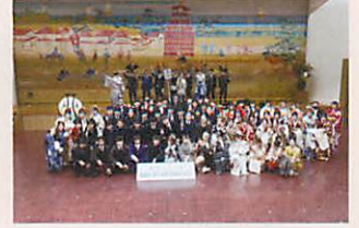
玉出中学校 卒業生