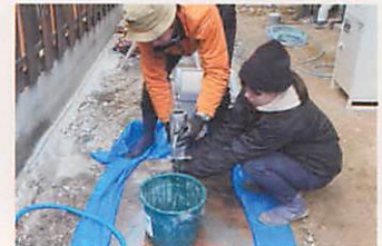
経験を活かして井戸水の備え