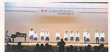
7組の出演がありました かべにらくがきや～～