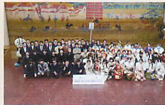
天下茶屋中学校 卒業生