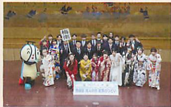
梅南中学校 卒業生