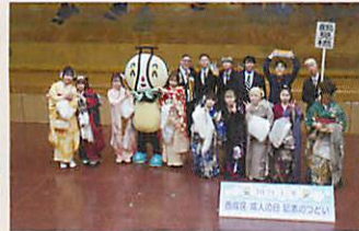
鶴見橋中学校 卒業生