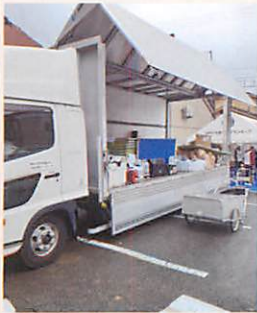
5トントラックに支援物資