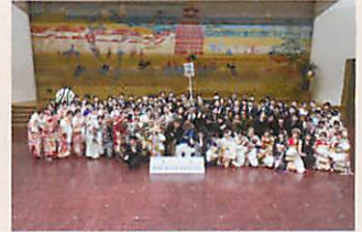
成南中学校 卒業生