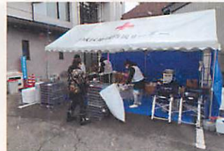
降りすぎる雪の中で