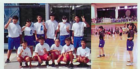
水泳部・バドミントン部