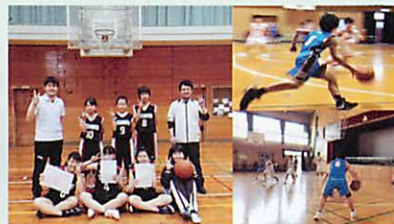
バスケットボール部(男子・女子)