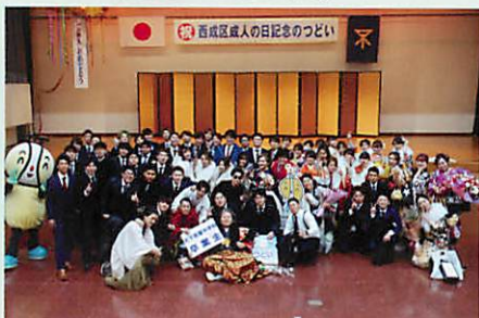
天下茶屋中学校 卒業生