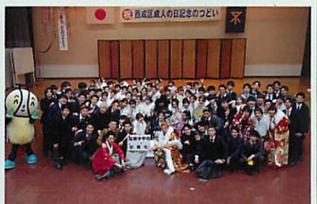
成南中学校 卒業生