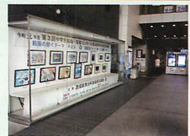
区民ギャラリーでの展示