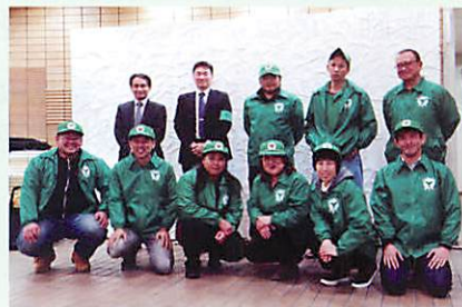
冬は緑のジャンパーで巡視