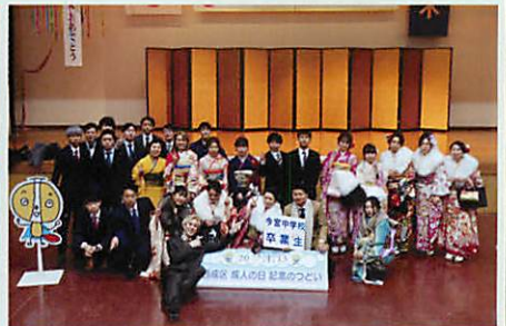
今宮中学校 卒業生