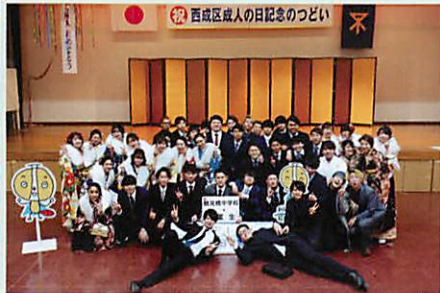
鶴見橋中学校 卒業生