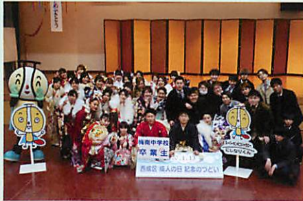
梅南中学校 卒業生