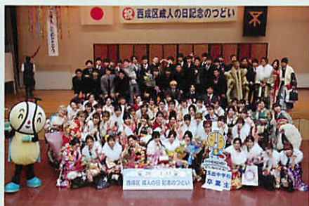
玉出中学校 卒業生