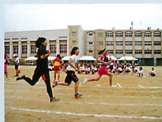
部活動対抗リレー